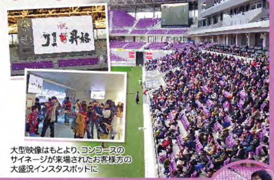
大型映像はもとより、コンコースのサイネージが来場されたお客様方の大盛況インスタスポットに

11月20日(土)のファジアーノ岡山戦に続き11月28日(日)ジェフユナイテッド千葉戦も、サンガスタジアム by KYOCERAにおいてパブリックビューイングが開催されました。昇格が懸かった28日、会場には約1,700名のファン、サポーターにお集まりいただき、スタンドから熱い声援を送っていただきました。試合同様、声を出しての応援はできませんが、ホームゲームさながらの拍手での後押し、皆さまの熱い思いは間違いなく選手たちへも届いたことでしょう。VIPラウンジや、記者席など有料観戦席も設置されましたがいずれも即日完売の盛況ぶりでした。もちろんアウェイの地へもたくさんのファン、サポーターが駆けつけてくださったことは言うまでもありません。正に京都サンガF.C.に関わる全ての人が一心になっての総力戦!そして、タイムアップ、昇格決定の瞬間には、歓びに沸くチーム映像と共にひととき大きな拍手の嵐、そしてスタンドには「祝 J1 昇格おめでとう!!」の横断幕が掲げられました。サンガスタジアム by KYOCERAでは悲願達成の一本締めでパブリックビューイング終了となりました。