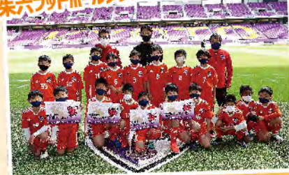
朱六フットボールクラブ