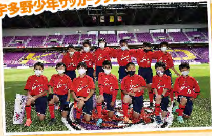
宇多野少年サッカークラブ