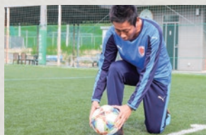
①靴ひもの所でボールの中心を蹴ろう。