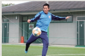
②ボレーキックは全身のバランスも意識して。