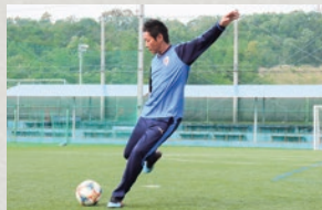
②助走は斜めから入るのがコツ！