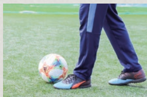
①軸足の置く位置を考えよう。