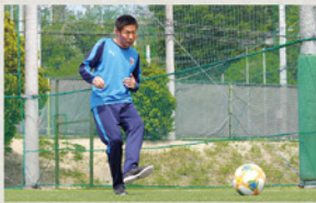
ボールの真横に軸足を置き、ボールを蹴りたい方向につま先を向ける