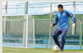
ボールの中心をしっかりと蹴る

インサイドキックは、ボールを一番正確に蹴ることができますが、ボールのスピードは弱くなりがちです。なので、しっかりとボールの中心を蹴りましょう！