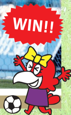
第3節/Uvance とどろきスタジアム by Fujitsu AWAY